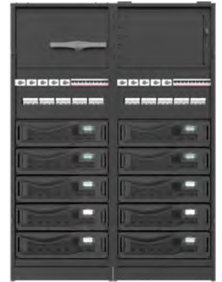
Top cable entry