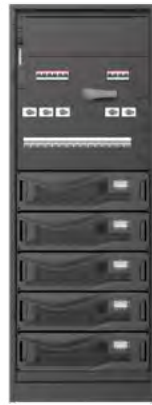
Top cable entry