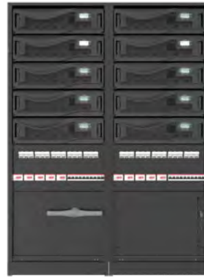
Bottom cable entry