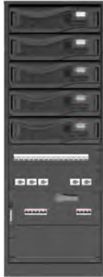
Bottom cable entry