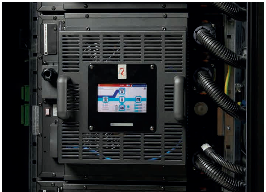
Sentryum Rack-Modul (in 19-Zoll-Gehäuse integrierte Stand-alone-Lösung) – geeignet für Installation in beliebigen 19-Zoll-Gehäusen.