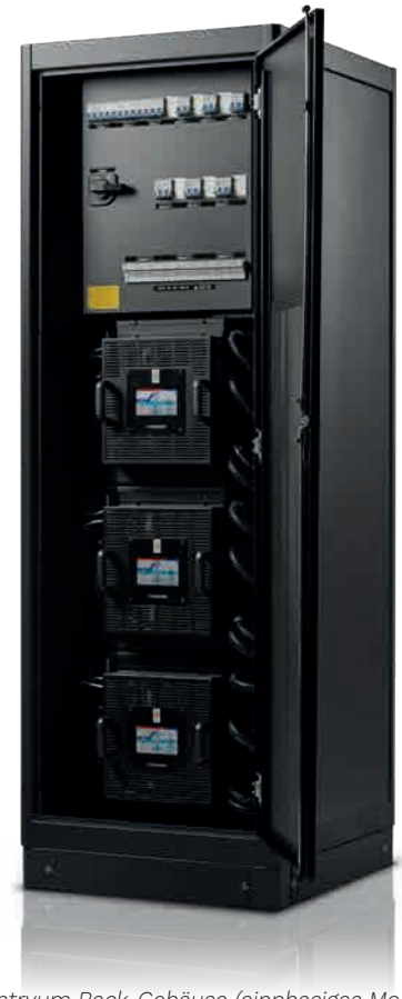
Sentryum Rack-Gehäuse (einphasiges Modell).

Verminderung des Elektrolytverbrauchs und Erhöhung der Gebrauchsdauer von VRLA-Batterien);